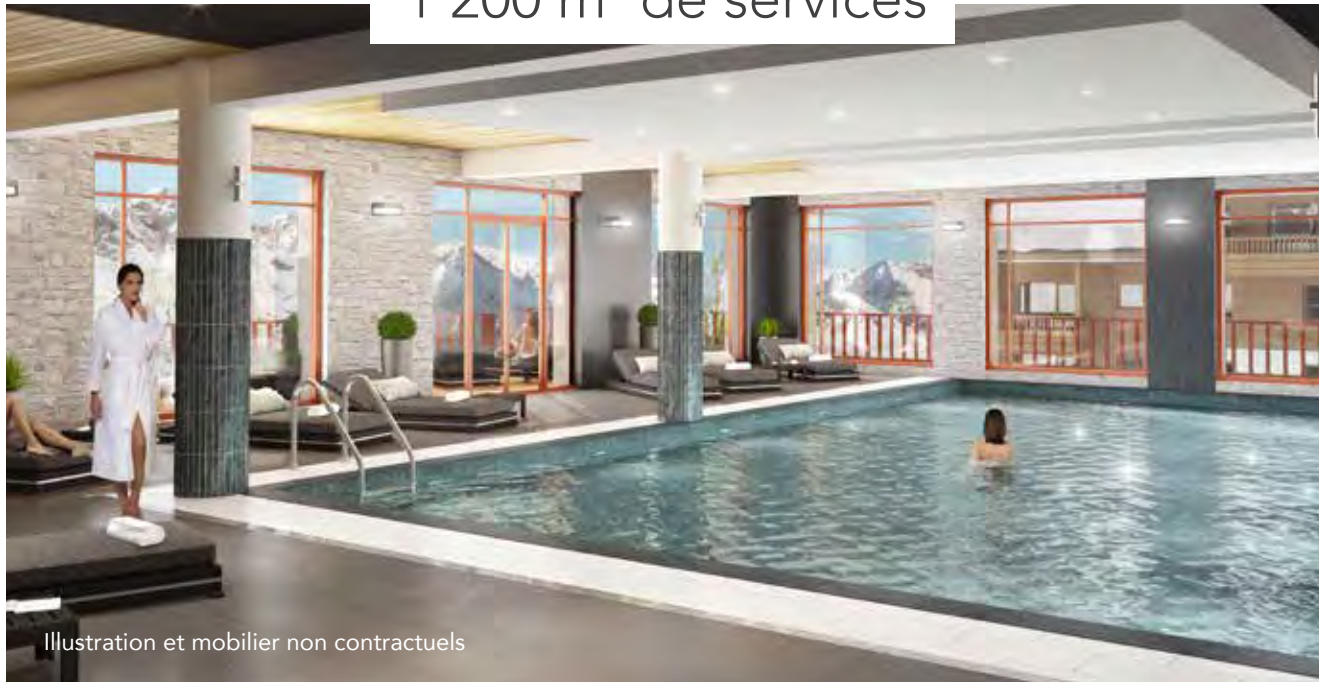
Illustration et mobilier non contractuels