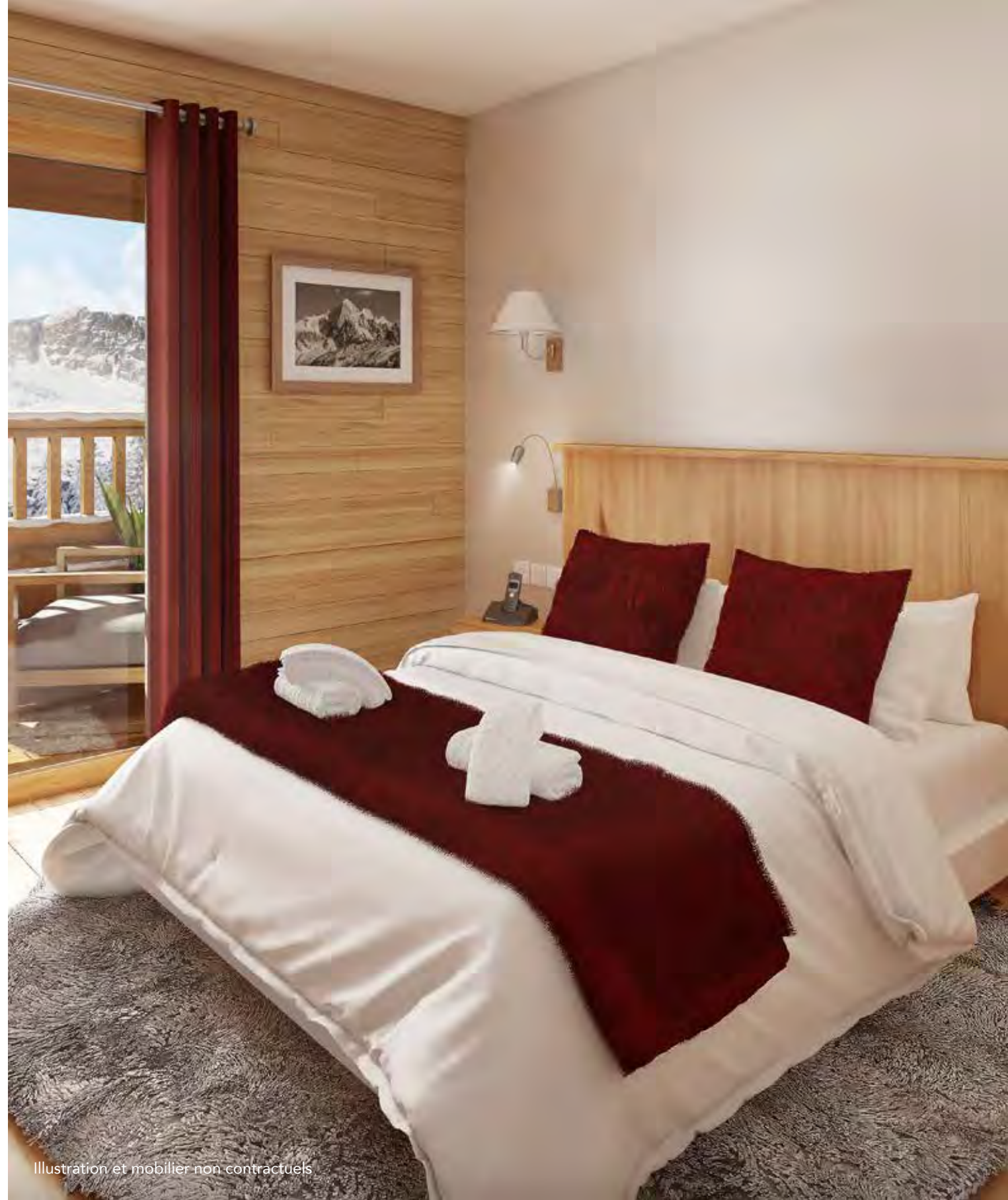
Illustration et mobilier non contractuels