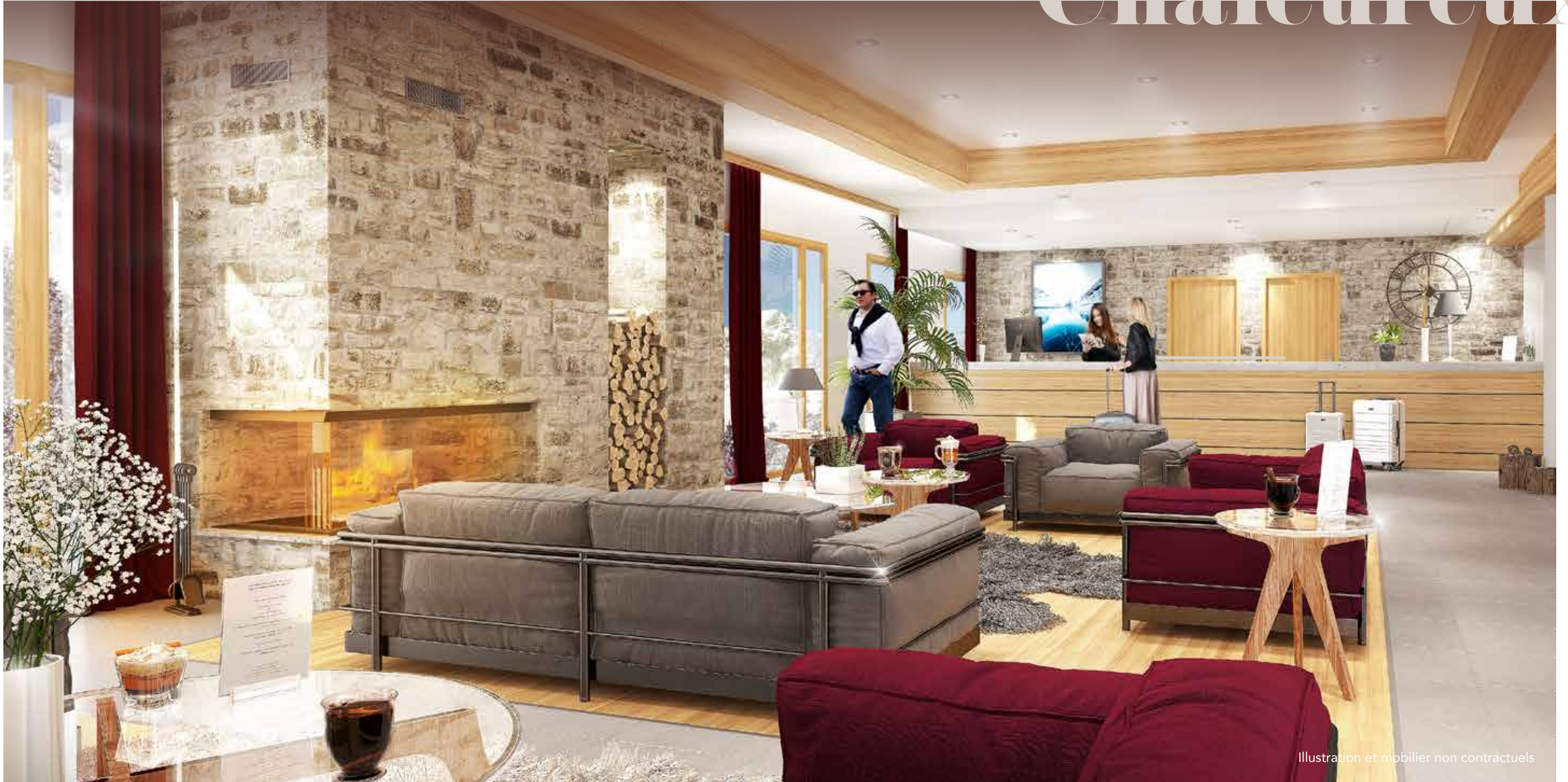
Illustration et mobilier non contractuels

Des espaces communs confortables et chaleureux