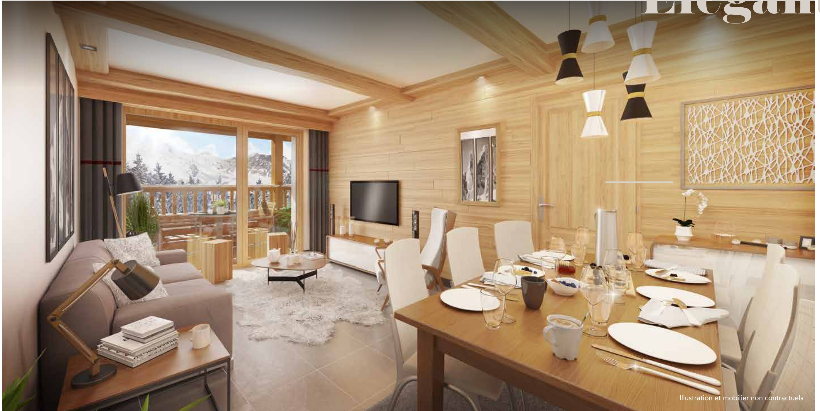
Illustration et mobilier non contractuels